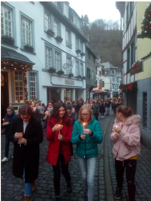
Fröhschicht im Advent: Mache dich auf und werde Licht.

Schülerinnen sind an der Vorbereitung und Gestaltung der Gottesdienste auf unterschiedlichste Weise beteiligt. Dabei wird Rücksicht auf ihre Fähigkeiten, Möglichkeiten und ihre Motivation genommen.