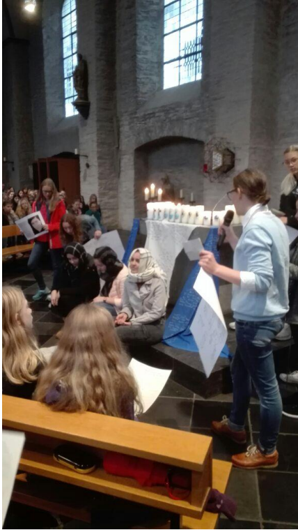
Wortgottesfeier zum Fest der Heiligen Ursula