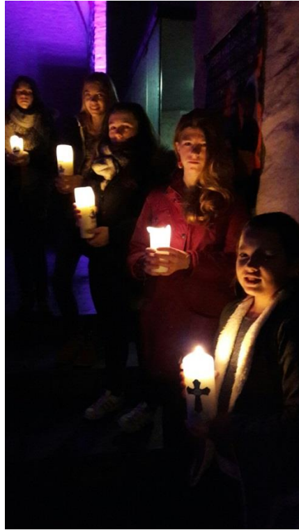
Wortgottesfeier zum Beginn der Weihnachtsferien / Einzug