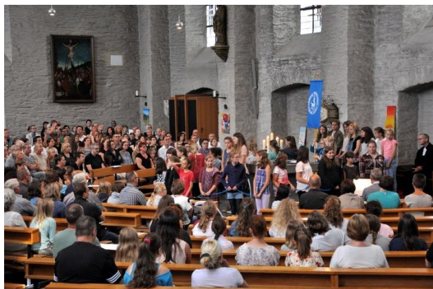
Ökumenischer Gottesdienst zur Einschulung: Willkommen auf dem St.-Ursula-Schiff!