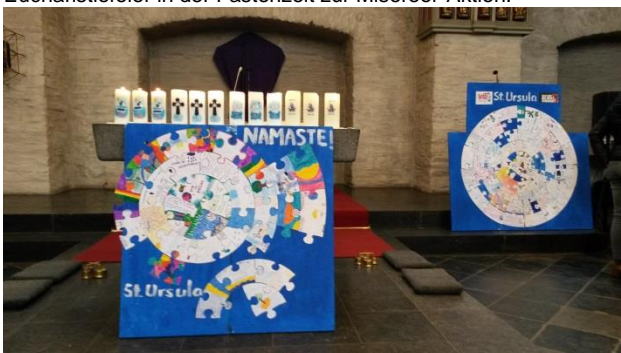
Eucharistiefier in der Fastenzeit zur Misereor-Aktion.